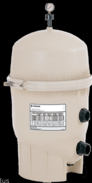
Clean &amp; Clear Plus