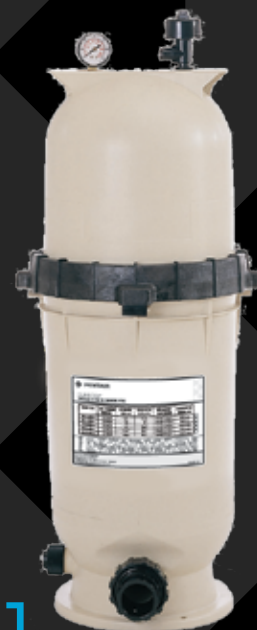
Clean &amp; Clear