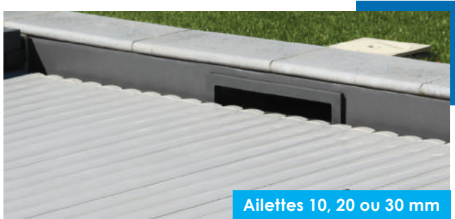
Ailettes 10, 20 ou 30 mm

4 types d'ailettes, assorties aux lames, permet de réduire le jeu fonctionnel entre le tablier et le bord du bassin.